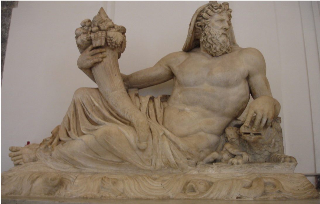
Naples, Musée archéologique (provenance : Pompéi), 1er siècle après J.C., marbre.