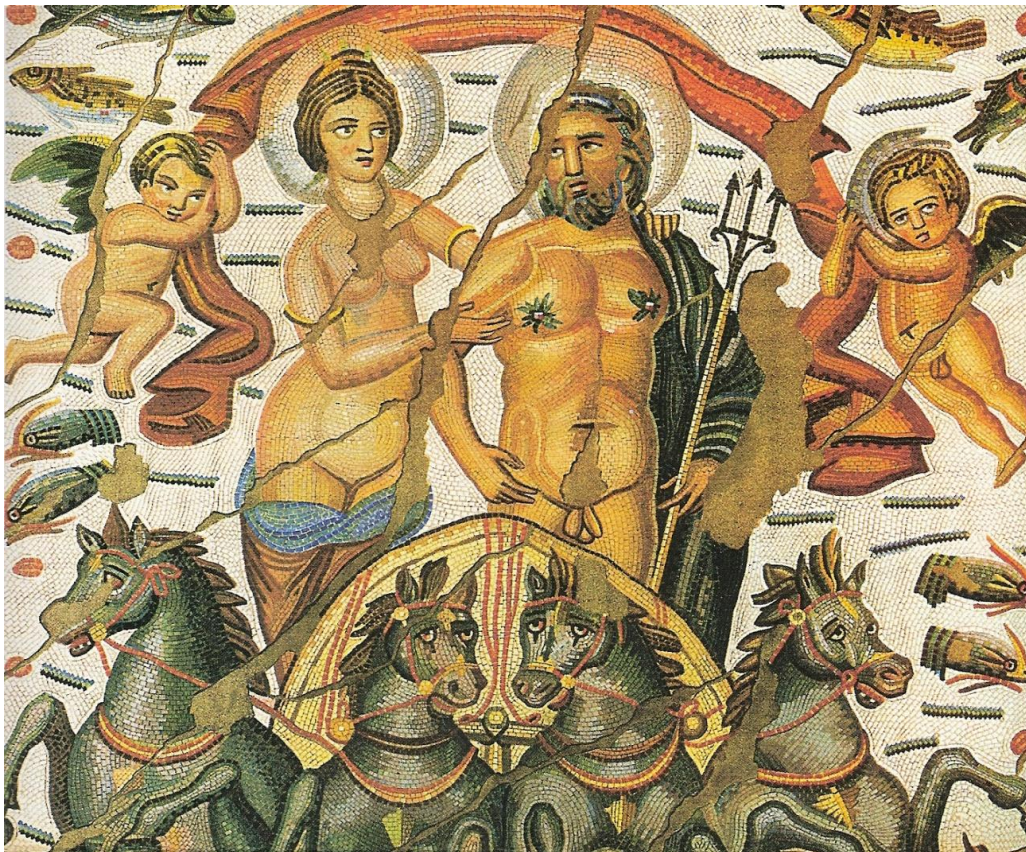
Mosaïque trouvée à Cirta (Algérie), conservée à Paris (musée du Louvre)