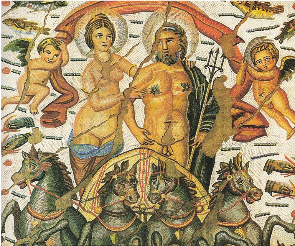
Mosaïque trouvée à Cirta (Algérie), conservée à Paris (musée du Louvre).