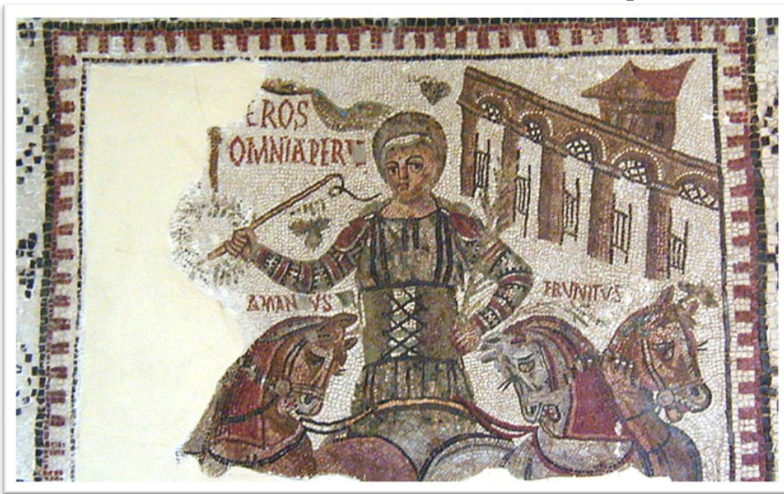
Mosaïque trouvée à Dougga, IV e siècle, Musée du Bardo (Tunisie)